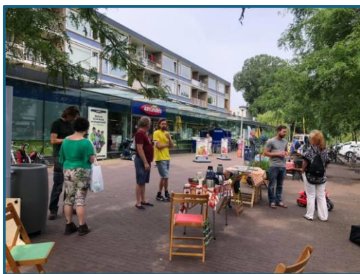
Bewoners denken mee over nieuwe inrichting