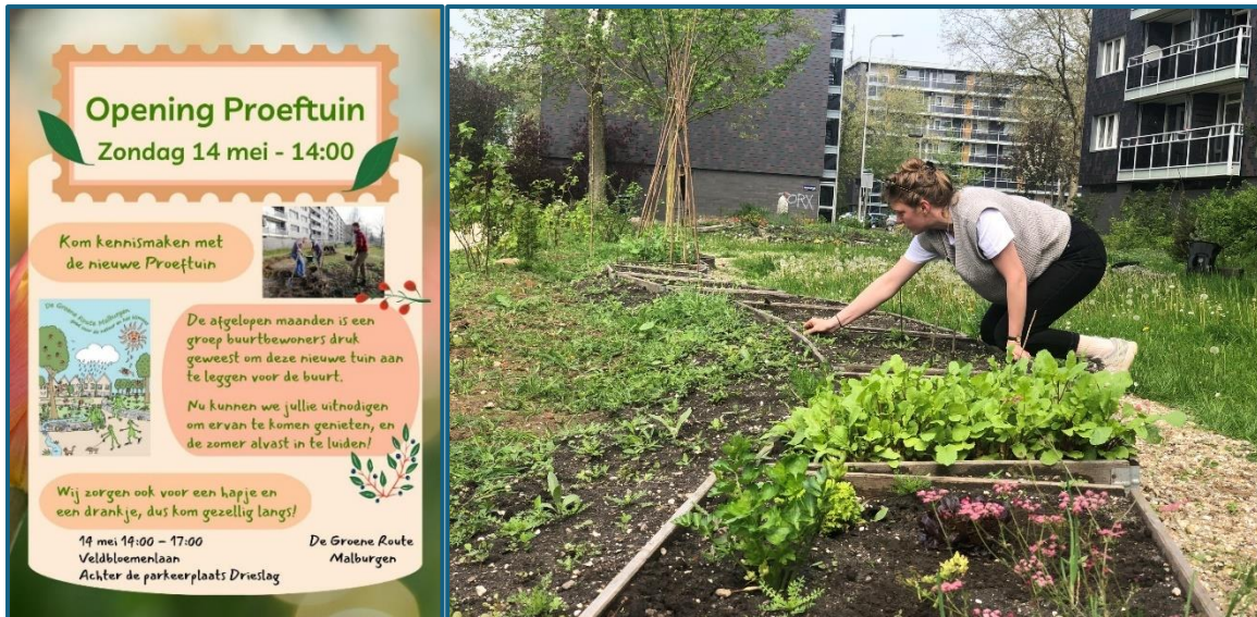
Veldbloemenlaan: een monotoon grasveld is omgetoverd tot buurttuin, de Proeftuin genaamd