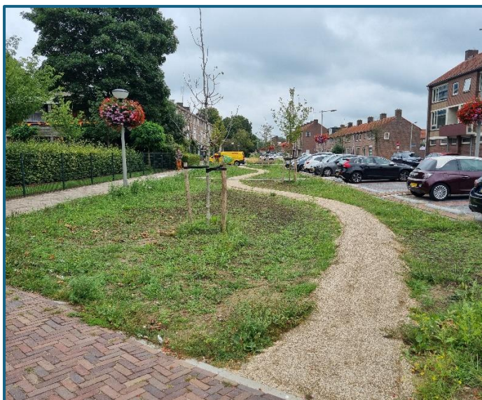
Nieuw pad in de Akkerwindestraat