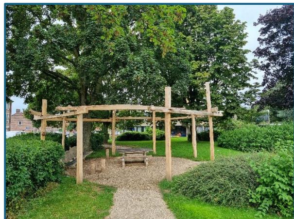
1 vd nieuw aangelegde ontmoetingsplekken langs het nieuwe wandelpad

Hierdoor is een omgeving ontstaan die veel verschillende doelgroepen (ouderen, volwassenen, (groot)ouders, kinderen, jongeren) aanzet tot lopen.