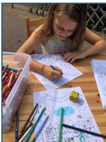
Jong en oud is uitgedaagd om mee te denken