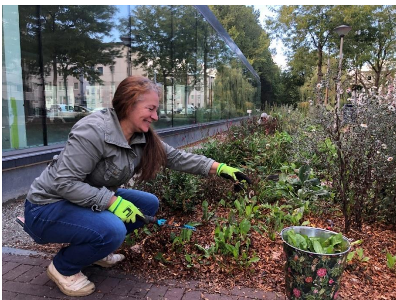
Onderhoud aan de Veldbloementaan in Malburgen-West door bewoners.