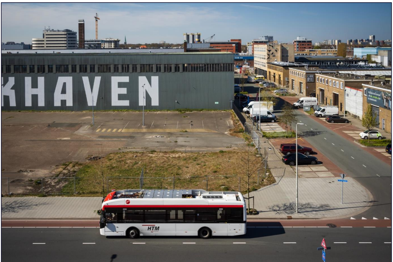
De huidige OV-voorziening door de Binckhorst: bus 28.

Het openbaar vervoer zal toenemen in de wijk met de transformatie. Er wordt gewerkt aan verbeterde busverbindingen en een vorm van hoogwaardige openbaar vervoer, zoals een railverbinding. Vanuit No-Regret pakketten worden er ook Parkeerhubs voorgesteld. Sommige maatregelen zijn al op korte termijn te verwachten.