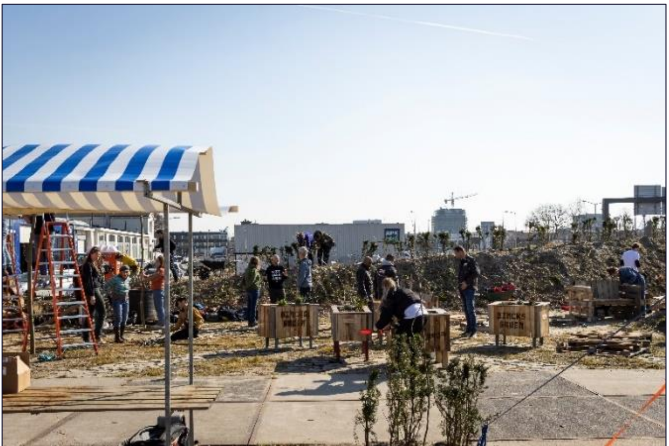
Foto boven: de CarWeide: de opening door wethouder Bredemeijer van Den Haag