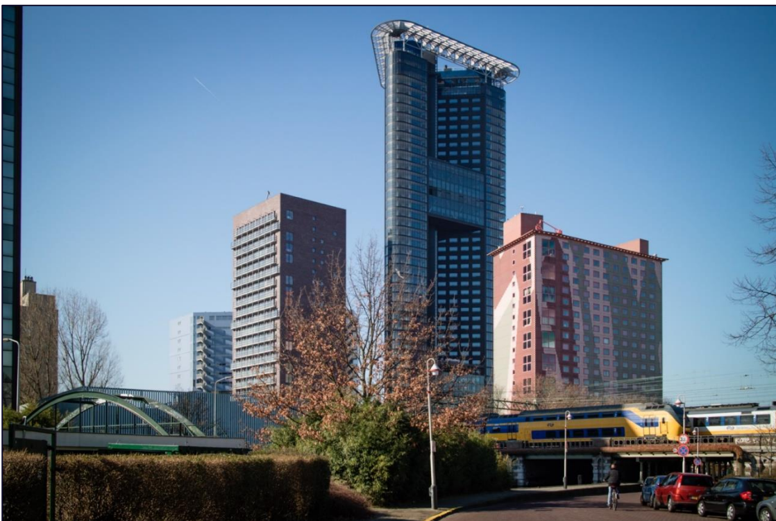
De verbinding met omliggende delen van de stad aan het Trekvlietplein, in de noordoostelijke hoek van de Binckhorst: links een voetgangersbrug richting station Hollands Spoor en rechts een donkere onderdoorgang richting het centrum.

Stadsparken, scholen, sportvoorzieningen en zorg zullen op een laagdrempelige manier, via fijnmazige structuren bereikbaar moeten worden. Dit is geen makkelijke maar wel een noodzakelijke opgave. Hierin ligt tevens een inclusiviteitsprincipe dat in de stad gehanteerd moet worden.