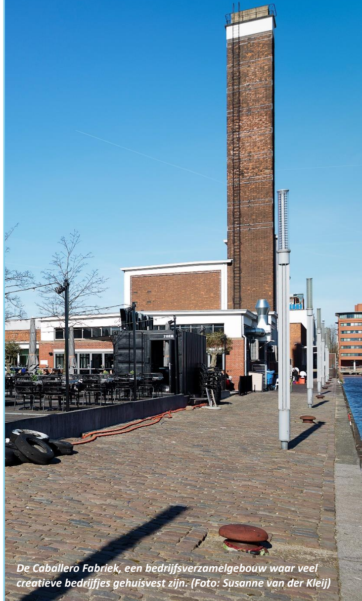
De Caballero Fabriek, een bedrijfsverzamelgebouw waar veel creatieve bedrijfjes gehuisvest zijn.