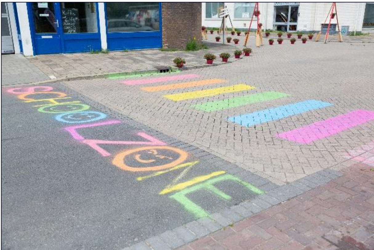
Foto boven: Geparkeerde auto's blokkeren het fietspad op de Zonweg.