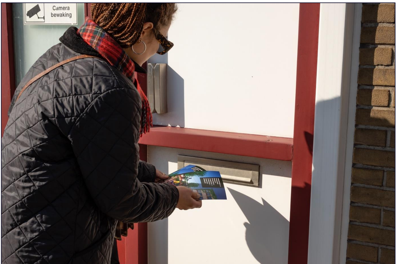
Flyeren om ondernemers enthousiast te maken voor vergroening van de gevel van hun bedrijfspand.

Het introduceren van een kleine schaal staat echter nog haaks op de industriële maat die nu overheerst, zoals de breedte van straten in de openbare ruimte. Hier is veel verharding, maar ook hele lange anonieme gevels of openbare ruimte die wordt begrensd door hekwerken. Aantrekkelijke routes betekenen ook dat je veilig kunt lopen, in een prettig klimaat. De rol van groen en goede afbakening van de voetgangers plek in de openbare ruimte is daarbij cruciaal.