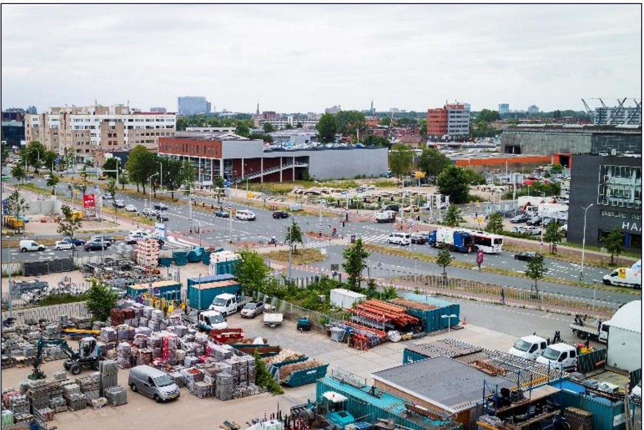
Huidige uitzicht op de locatie van het Waterfrontpark.

De kade is de belangrijkste route door het Waterfrontpark. Naast de openbare kade geven de drie havens - de Poolsterhaven, de Fokkerhaven en de Binckhorsthaven - betekenis aan de naam van het gebied. De minicoalities juichen deze plannen voor permanent groen in de Binckhorst toe, maar wijzen erop dat de realisatie waarschijnlijk het slotstuk van de transformatie zal zijn. In de tussentijd zijn inspanningen voor tijdelijke vergroening essentieel voor de leefbaarheid van het gebied.