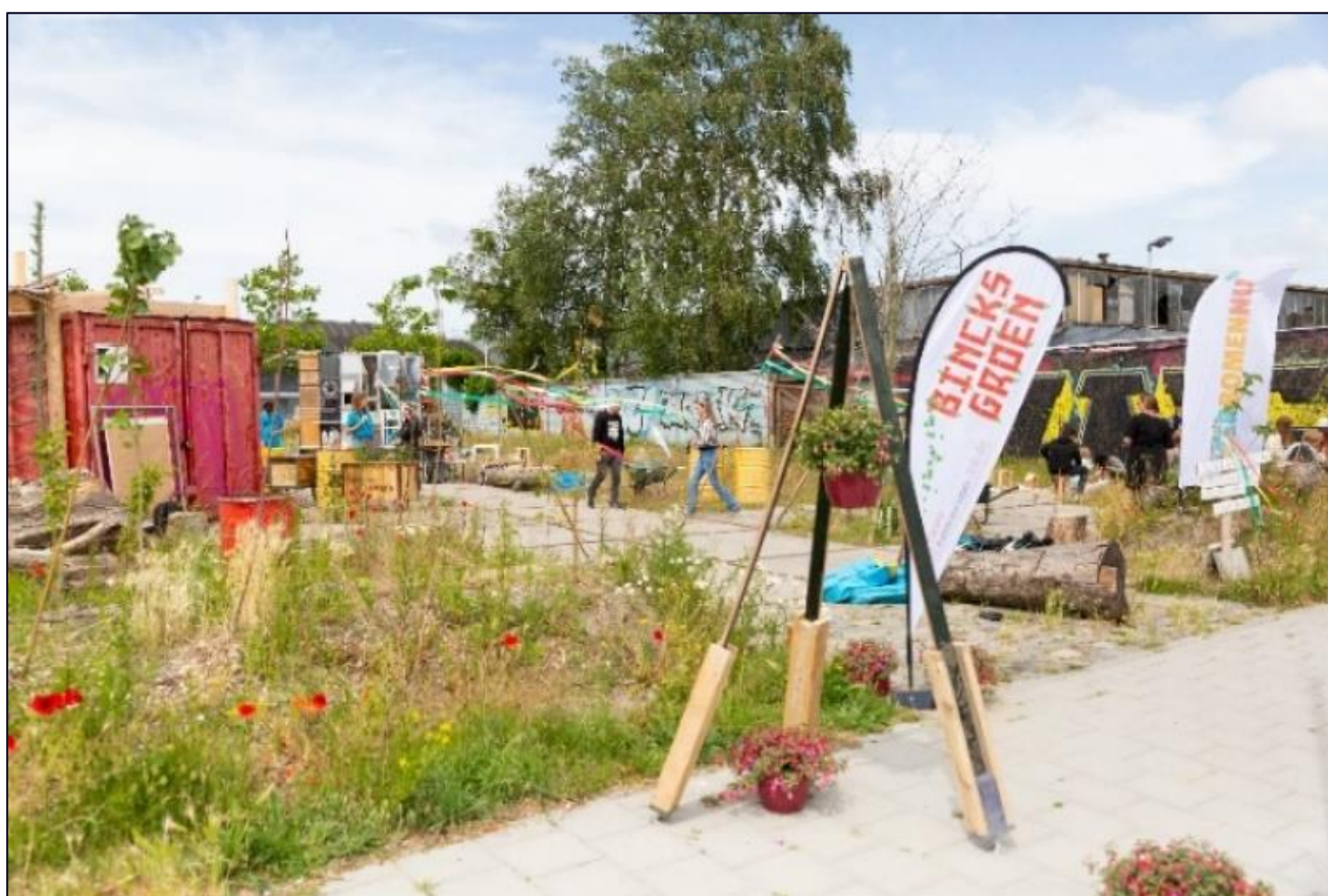
Foto's: Activiteiten op de CarWeide en bij Kindcentrum De Binck tijdens de guerrilla-actie op Vaderdag 2022.

Op Vaderdag, 19 juni 2022, organiseerde stichting I'M BINCK als partner van de City Deal Ruimte voor Lopen, een guerrilla-actie waarbij Kindcentrum De Binck via de Castorstraat werd verbonden met de CarWeide met een bloemenslinger. Zo werden de bezoekers van de school geleid naar de CarWeide, waar ze kennis konden maken met dit stukje groen. Op de CarWeide zelf waren in het kader van Vaderdag verschillende activiteiten georganiseerd voor ouders en kinderen.